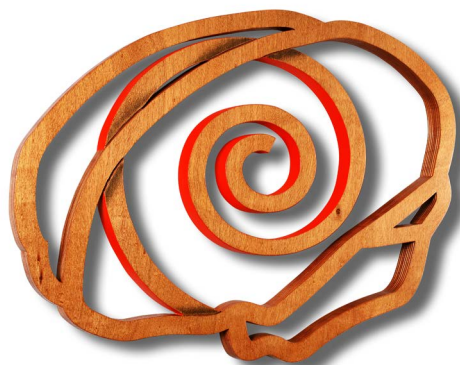
Reinier van den Berg